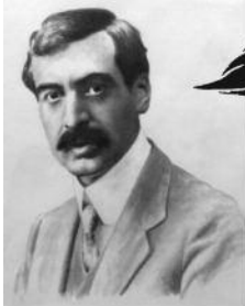
“О, Чирпане! Чирпане!” Пейо Яворов Рисунка: Костадин Събев