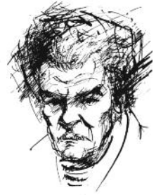
"Воистина отбрулен лист..." Димитър Данаилов Рисунка: Владимир Кондарев

Притурка на в. "Чирпански новини", брой VI, 2016 г.